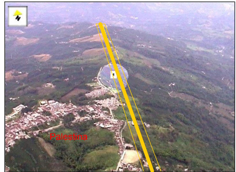
* Panorámica desde la zona sur

Se ubica en el municipio de Palestina, a 27 Km. de Manizales y a 30 Km. de Pereira.